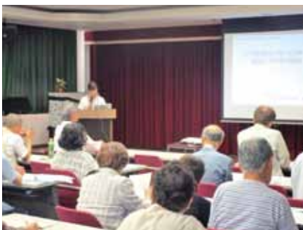
廣田がん性疼痛看護認定看護師