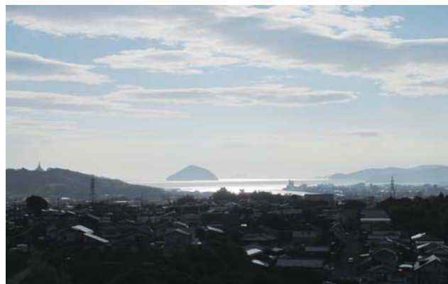
病院5階ラウンジからの臼杵市街（日の出前）

臼杵は皆さんご存知のように城下町で町のいたるところに風情のある景色が残されており、また、フグをはじめ大変豊かな食文化もあります。臼杵城址の桜祭り、大分の3大祇園祭の1つ臼杵祇園祭、石仏蓮まつり、ロマンチックな竹宵などなど、ぜひ機会を見つけて臼杵にお出でください。