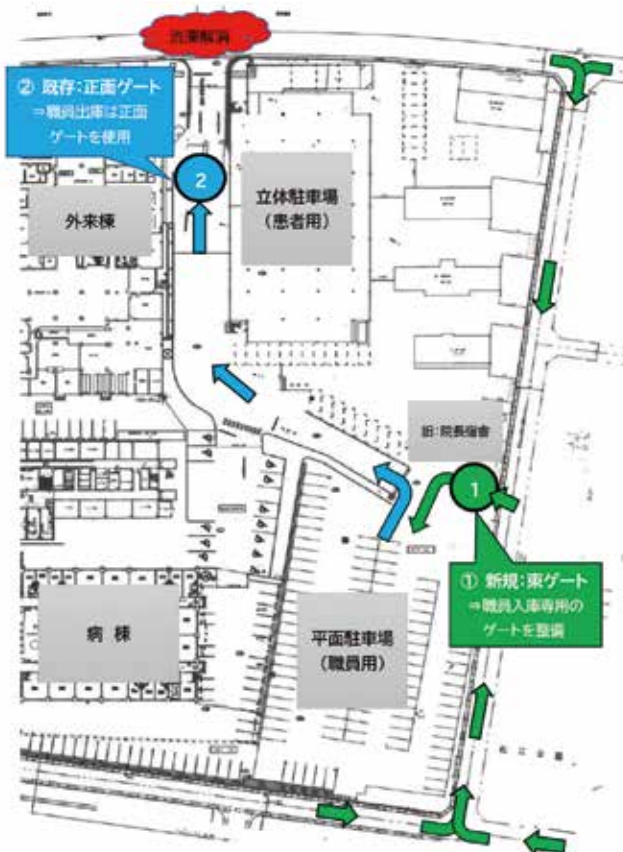
今回の整備による職員車両の流れ