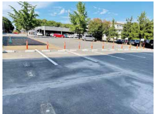
新たに職員用区画を整備