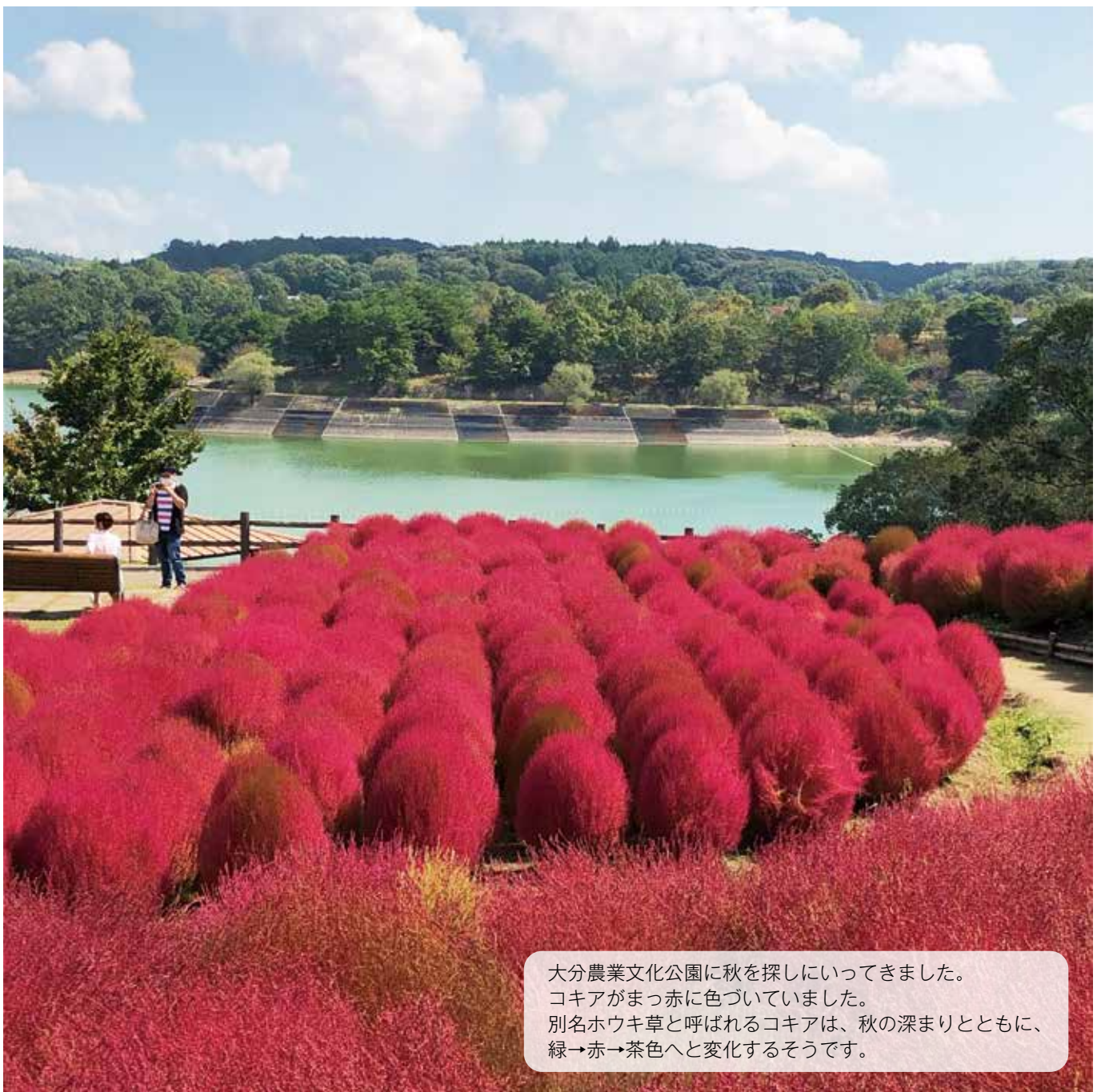
大分農業文化公園に秋を探しにいってきました。 コキアが真っ赤に色づいていました。 別名ホウキ草と呼ばれるコキアは、秋の深まりとともに、 緑→赤→茶色へと変化するそうです。