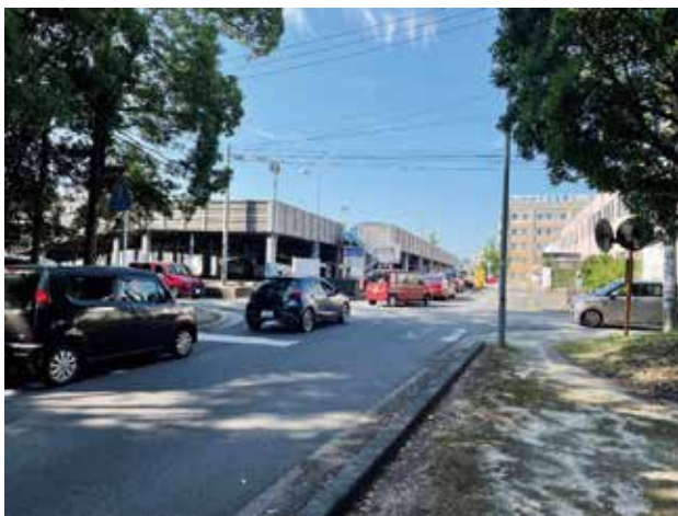
朝方の正面玄関付近

当院の院内駐車場は、外来棟に近接する立体駐車場（患者用）と、病棟に近接する平面駐車場（職員用）で構成されている。数年前に比べ、車で通勤する職員は増加傾向にあり、院内駐車場は手狭な状況が常態化している。特に朝方、外来の受診患者と、通勤の職員が集中する正面玄関前の駐車場ゲート付近は、渋滞を余儀なくされていた。