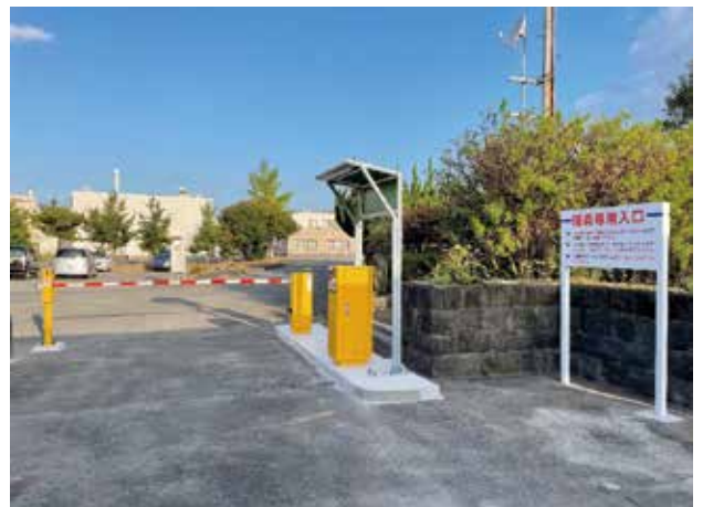
工事完了：院外から撮影

更に、外部から入庫しようとする車両に職員専用の入口であること、院内から出庫しようとする車両にUターンを促す「看板」2枚を業者へ依頼した。これらの作業は概ね順調に進み、令和3年9月末に設置工事を含め全て完了した。