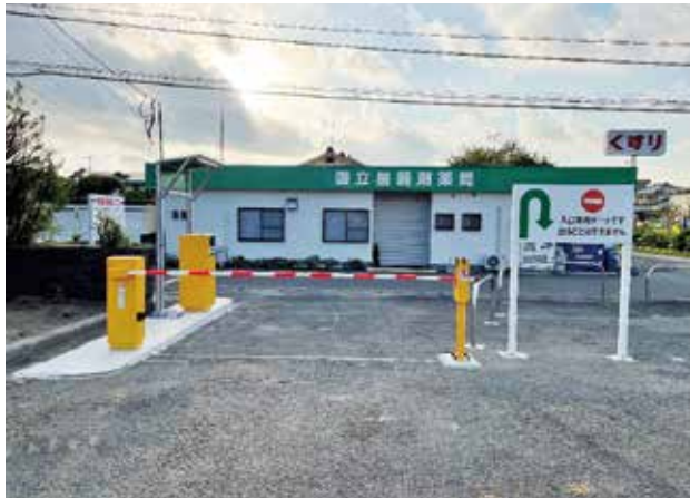
運用開始：院内より撮影

院内情報Webで職員に事前周知のうえ、令和3年10月4日(月)東ゲートの運用が開始となった。これまで、外来の受診患者と交互に正面玄関前ゲートから入庫していた職員の車両が、別のゲートに流れることで朝の渋滞緩和につながる。また、職員の出庫は午後がメインとなるため、外来受診後の患者と重なることは少ない。今回、入庫専用機能に絞る費用を縮減した点が、実現に至ったポイントと考える。